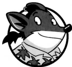
TRAP STILTON NESUFERIT ȘI IRONIC, VĂRUL LUI GERONIMO