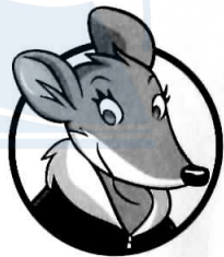
TEA STILTON SPORTIVĂ ȘI ENERGICĂ, TRIMIS SPECIAL AL ZIARULUI VOCEA ROZĂTOARELOR