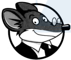
GERONIMO STILTON ȘOARECE INTELECTUAL, DIRECTOR AL ZIARULUI VOCEA ROZĂTOARELOR